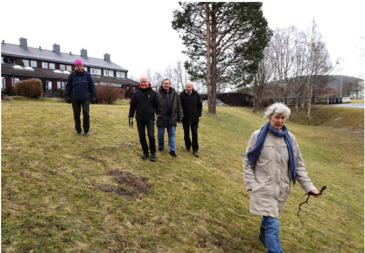
Beboerne i Fredlydalen tar vare på området, som er åpent og tilgjengelig for alle i nabolaget. Nå kjemper de for å hindre at kommunens planer endrer dalens karakter.

Nå frykter naboene at kommunens planer om nok en gang å åpne bekken og bygge turvei vil føre til at kommunen overtar tomtene deres.