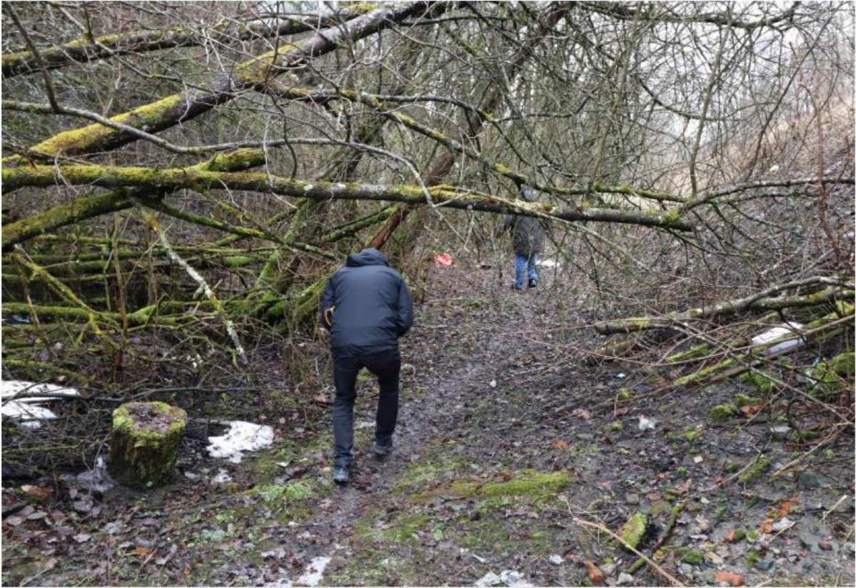
Beboerne er bekymret for at verdifulle trær vil bli ofret hvis kommunen får gjennomslag for sine planer om å åpne Fredlybekken.