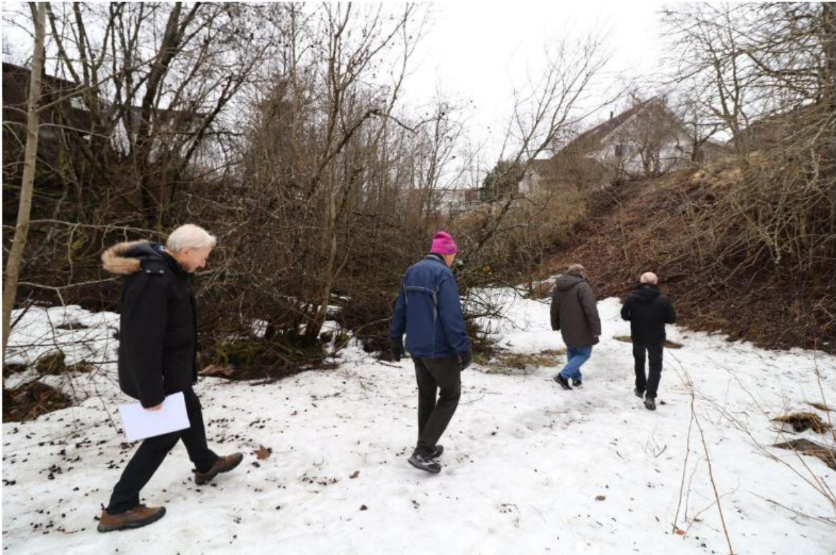
Dagens slake dalføre skjuler en dramatisk fortid. Etter et ras på 70-tallet ble den bratte dalen fylt igjen. Nå frykter beboerne at kommunens planer vil endre landskapet på nytt.

De er også skeptiske til kommunens mål om økt biologisk mangfold.