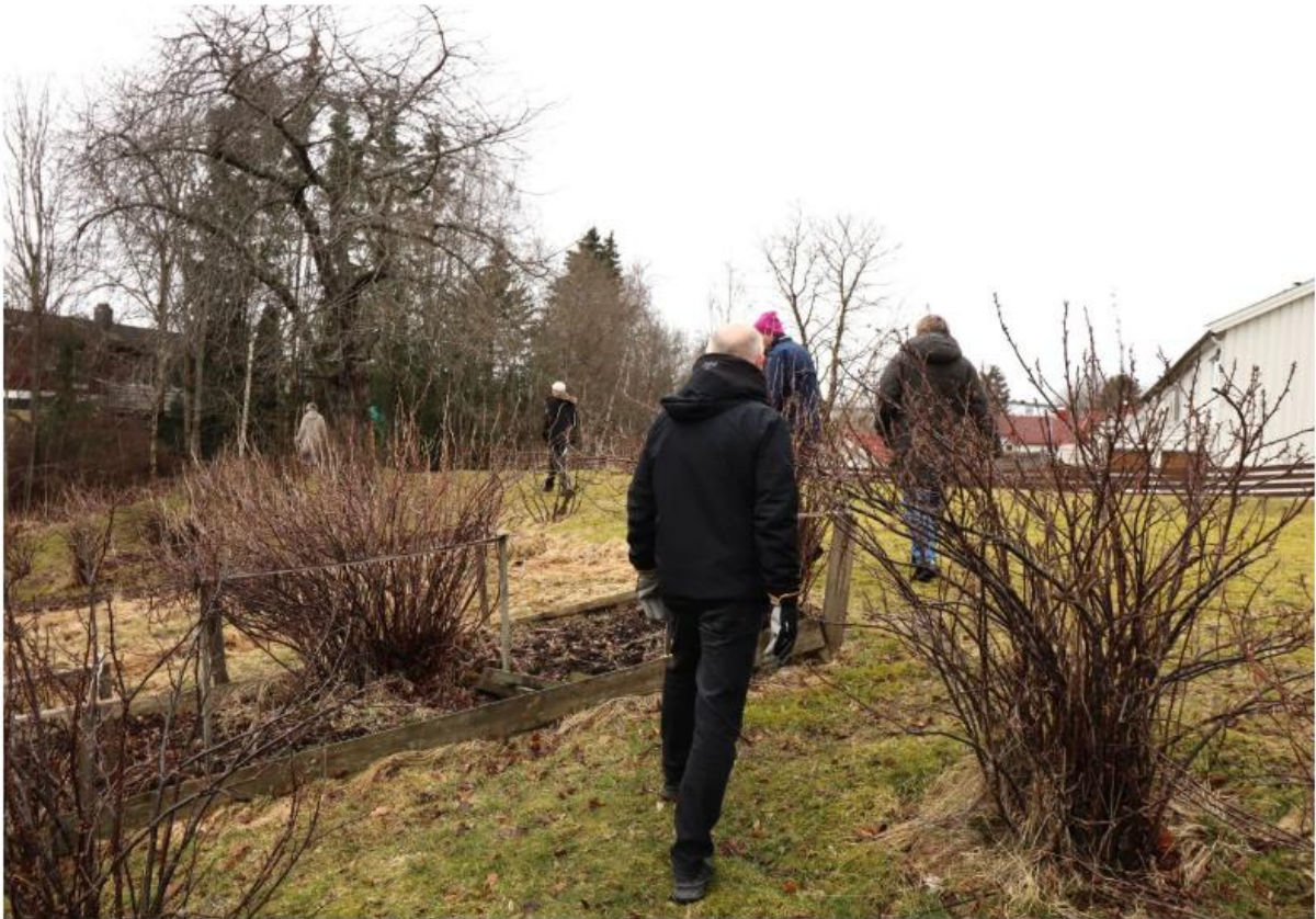
De felles parsellhagene er et viktig samlingspunkt for beboerne, som har stor glede av å dyrke og stelle området sammen.