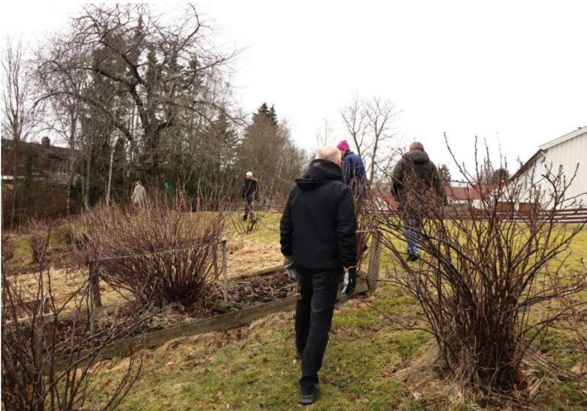
De felles parsellhagene er et viktig samlingspunkt for beboerne, som har stor glede av å dyrke og stelle området sammen.

Nå venter de spent på politikernes avgjørelse, vel vitende om at de kan miste et kjært område som i dag fungerer som en felleshage – og at garasjer og uthus kan gå tapt for å gi plass til gravemaskiner, bekk og grusvei.